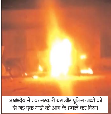
ऋषभदेव में एक सरकारी बस और पुलिस जांचे को दी गई एक गाड़ी को आग के हवाले कर दिया।

उदयपुर. नगर संवाददाता | पंचायत चुनाव में जिले की ऋषभदेव पंचायत के सोमावत गांव में मतगणना के बाद हारे हुए प्रत्याशी के समर्थकों ने एक सरकारी बस और पुलिस जांचे को दी गई एक गाड़ी को आग के हवाले कर दिया। इस दौरान ग्रामीणों ने मतदान बुथ पर पथराव भी किया गया और जमकर हंगामा किया। घटना की जानकारी पर मौके पर पुलिस के आला अधिकारी पहुंचे और स्थिति को नियंत्रण में किया। इस घटना में पोलिंग बुथ के सभी कर्मचारी और मतपेटिया सुरक्षित हैं।