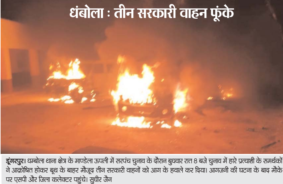
धंबोला : तीन सरकारी वाहन फूँके

पथराव शुरू कर दिया और जबरन मतगणना केन्द्र में घुस गए। एक साथ सैंकड़ों की संख्या में लोगों को देखकर वहां पर मौजूद पुलिसकर्मी भी इधर-उधर हो गए और इस बारे में उच्चाधिकारियों को बताया। वहां मतगणना केन्द्र में मौजूद अधिकारियों और कर्मचारियों ने जैसे-तैसे कर अपनी जान बवाई। आदिवासियों ने मतगणना केन्द्र के बाहर ही खड़ी एक पुलिस वाहन और कुछ ही दूरी पर खड़ी पोलिंग पार्टी की गाड़ी को आग लगा दी। जैसे ही सूचना मिली कि ऋषभदेव सर्कल के साथ-साथ अतिरिक्त जांचे को मौके पर भेजा गया। एक साथ भारी पुलिस जांचे को देखकर आदिवासी वहां भाग गए। पुलिस ने पकड़ने का प्रयास भी किया, परन्तु अंधेरे का फायदा उठाकर लोग फरार हो गए। मौके पर किसी तरह से आग बुझाने की सुविधा नहीं होने के कारण दोनों वाहन पूरी तरह से जल गए। हालांकि मतगणना केन्द्र में मौजूद अधिकारी और कर्मचारियों के साथ-साथ मत पेटियां पूरी तरह से सुरक्षित हैं।